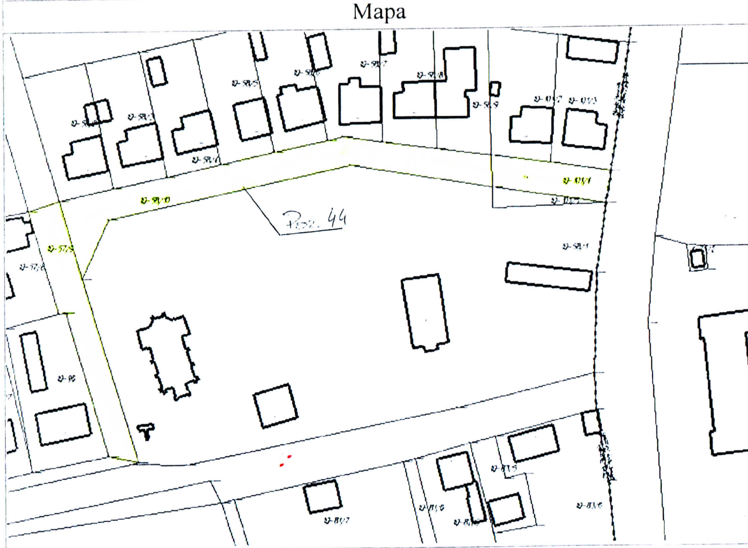
Sporządzono dnia: 26.10.2012 r. Wydruk ma charakter poglądowy i nie jest dokumentem

- do Uchwały Nr XXIII/137/12 Rady Gminy Waganiec z dnia 27 listopada 2012 r.